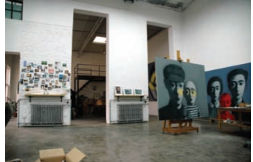
張曉剛氏のアトリエ

映画も公開されています。中国の映画で『向日葵』という作品です。その中に工場が出てきて、張曉剛という有名な中国人の現代作家の作品がしばしば出てきます。